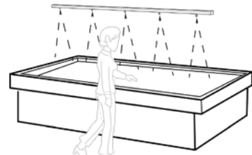
Îlot d'exposition ouvert

Dimensionnement: 2 modèles selon la longueur du rayon ou comptoir